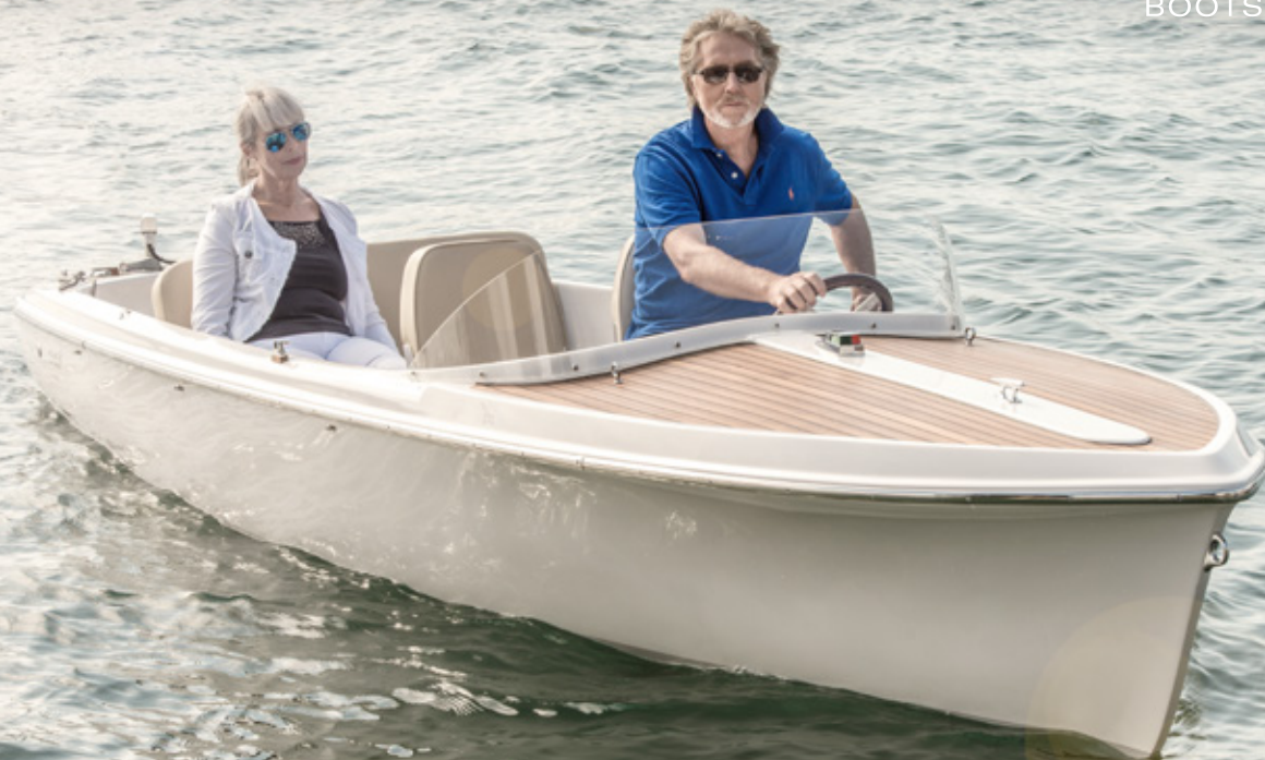
Elektroboot PEHN eVARIO 530